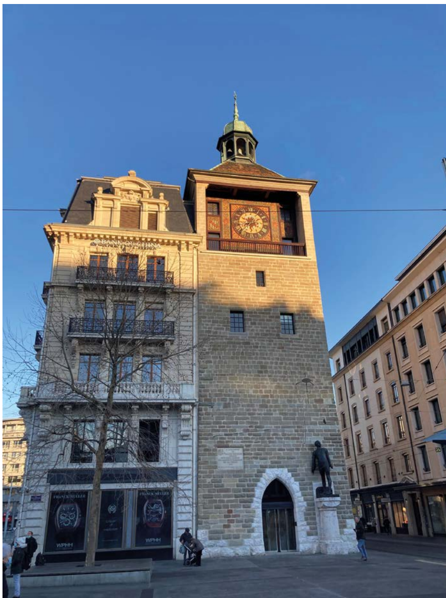
Plus de 1000 m 2 de locaux commerciaux à la Tour de l'Île 1 ont été loués à Bank of China.

Avec un volume de transactions de près de 1,6 milliard de francs, cela représente plus de 715 ventes, soit près de trois par jour ouvrable, pour un chiffre d'affaires dans le résidentiel en croissance de 45%. «Ce record est porté par l'excellente dynamique du marché. Une clientèle internationale a vu dans la Suisse un havre de paix en temps de Covid. C'est en Valais que Barnes Suisse a réalisé ses plus importantes ventes en 2021. Un chalet a atteint le prix de 27 millions à Verbier. Un autre s'est négocié à plus de 20 millions dans une autre station valaisanne. Dans le canton de Vaud, un bien est parti à 25 millions et une villa à 18 millions à Genève.»